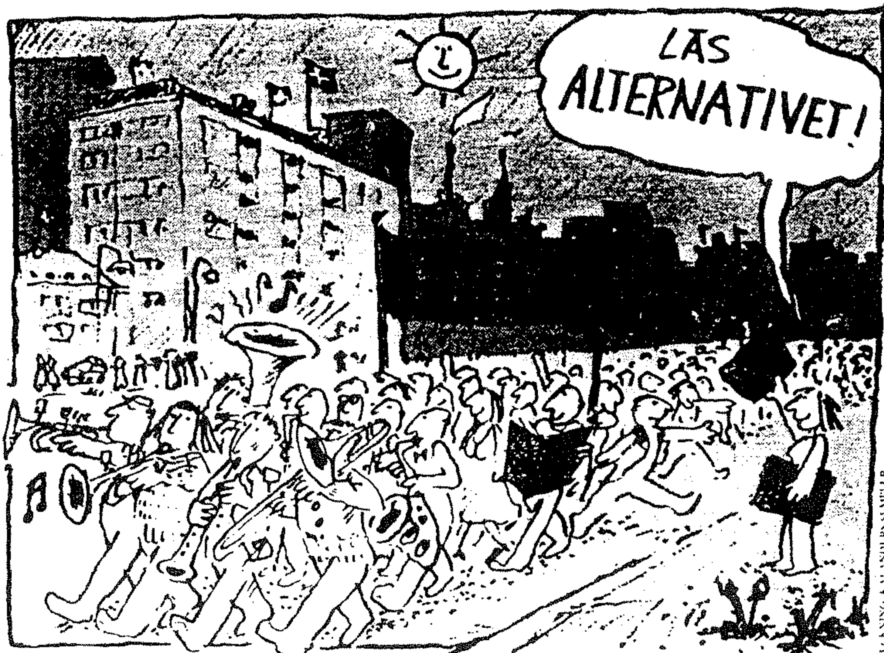
Svevta måste göra allt för att stoppa kappströmmen och stöda fredliga lösningar

2 Hotade naturtyper och arter ska beredas livsutrymme och ett mångformigt landskap ska garanteras genom lagstiftning.