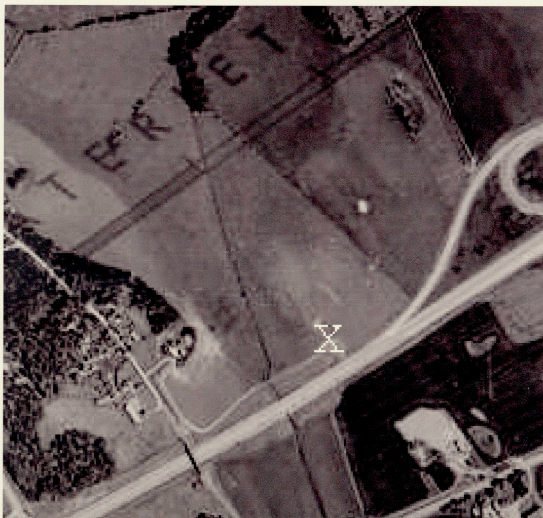
Herrebroområdet med nya E4:an. Det vita X:et markerar hållristningsklippan Raä 51. Observera grusvägen längs motorvägens norra sida.