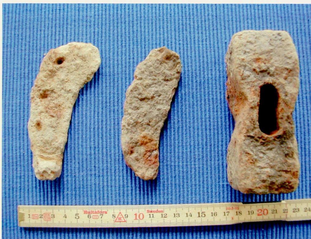
Fynden fotograferade före konservering.