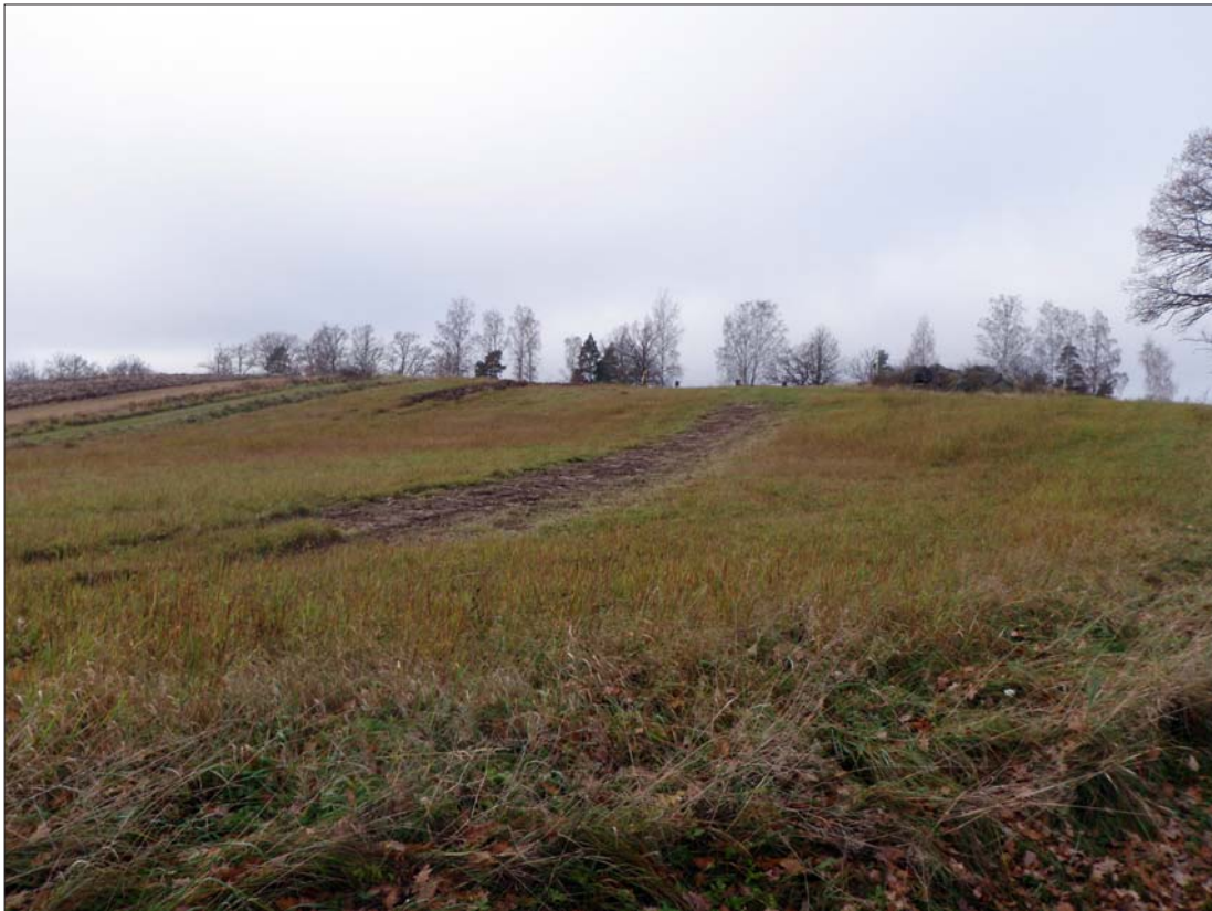
Figur 5. Den högre liggande åkermarken i söder bestod av en lägre plåtå i öster, närmast kameran och en högre i väster. På krönet till höger i bild ett större odlingsröse. I mitten av bilden ett av utredningsschakten i igenlagt skick.