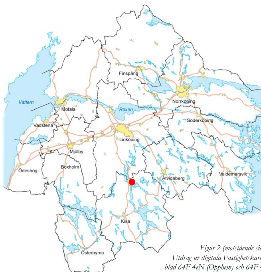
Figur 2 (motstående sida). Utdrag ur digitala Fastighetskartan, blad 64F 4eN (Opphem) och 64F 4eS (Rimforsa). Utredningsområdena för den arkeologiska utredningens etapp 1 (violett) och 2 (blå) är belägna strax norr om Rimforsa samhälle. Skala 1:10 000.