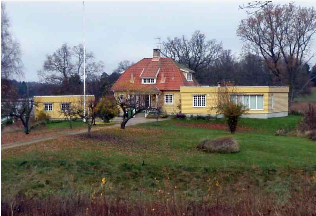
Figur 4. Bebyggelsen Udda består av ett bostadshus av 18-1900-talstyp med utbyggnader från 1970-tal.