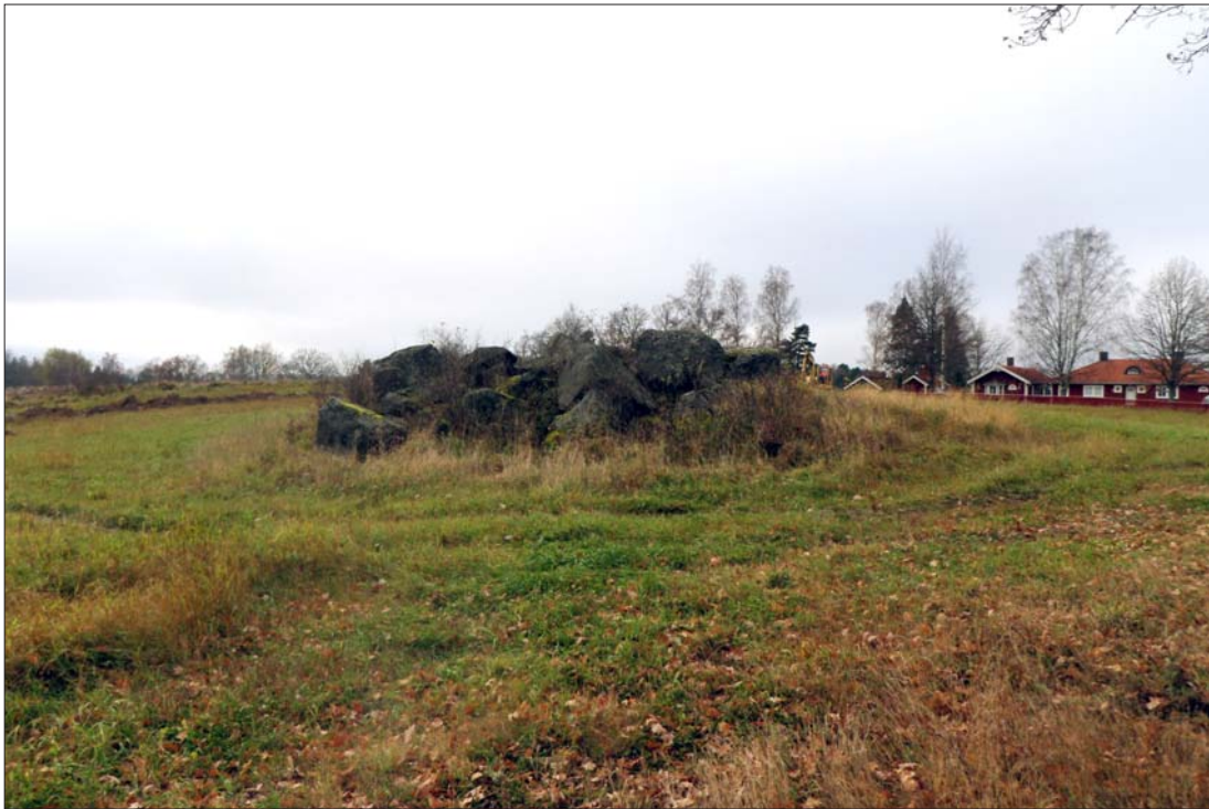
Figur 6. Ett odlingsröse med sten av ovanligt kraftiga dimensioner lög på krönet av åkermarken.

med den senare bebyggelsen Udda på fastighetskartan. Det är okänt när denna tillkommit (stilmässigt är dock det äldsta boningshuset från sent 1800-tal eller tidigt 1900-tal).