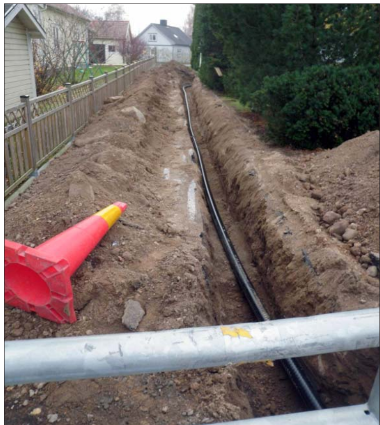
Figur 7. Schaktet i tomtmarken.