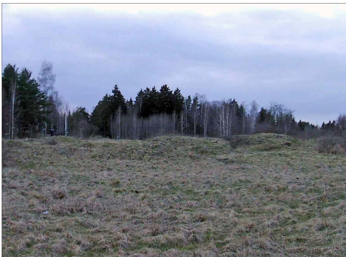
Figur 4. Den vikingatida delen av gravfält 15 består av tydliga högarna. Barrskogsvägen ligger i vänster utkant av bilden.

Då ingenting av arkeologiskt intresse framkom inskränktes dokumentationen till digitala foton.