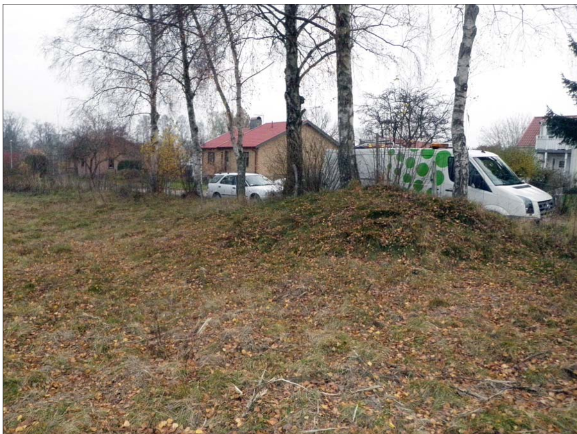
Figur 3. Gravhöj klyvd av Barrskogsvägen. Ungefär halva högen återstår. Foto Olle Hörfors, 2011.

Gravfältet RAÄ 15 består på den del som ligger intill förundersökningsområdet av markanta högar av tydlig yngre järnålderskaraktär, flera av dem ca 6-7 m i diameter