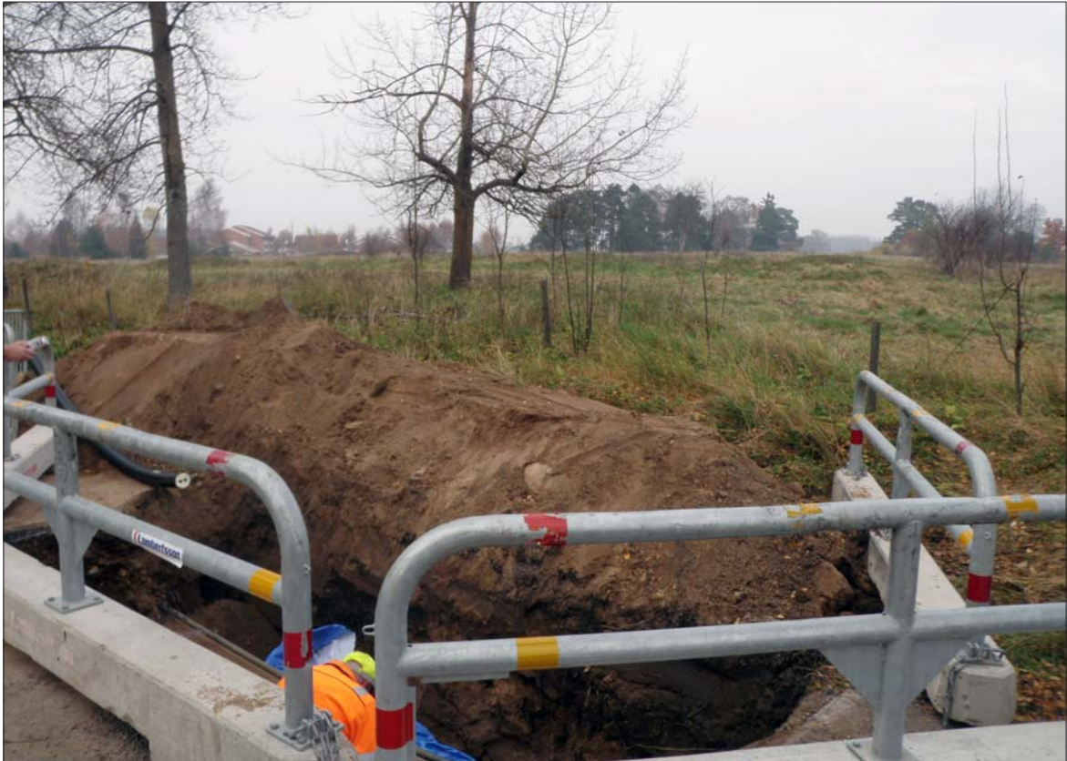
Figur 6. Anslutningsschaktet i gatan. Dumpmassorna ligger över den till ca 25% bevarade gravbögen. Massorna kunde tas bort utan ytterligare skador på gravbögen.