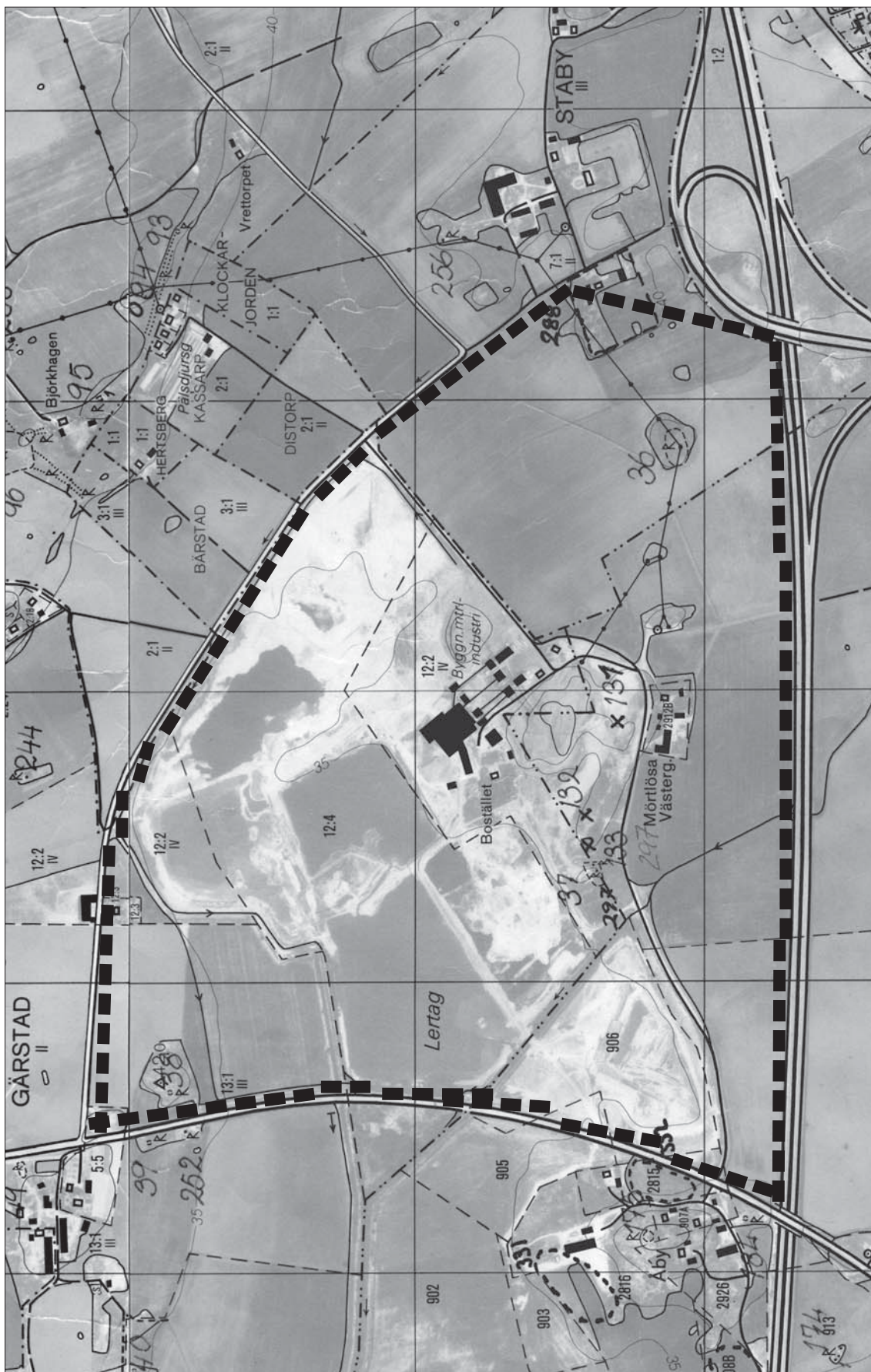
Figur 2. Utdrag ur Ekonomiska kartans blad 085 58 (8F 5i Tannefors) och 085 68 (8F 6i Rystad) med utredningsområdet markerat.