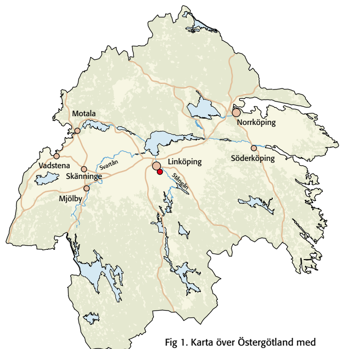
Fig 1. Karta över Östergötland med platsen för förundersökningen markerad.