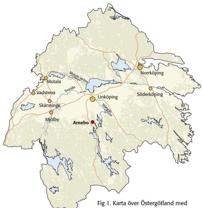
Fig 1. Karta över Östergötland med platsen för utredningsområdet markerat.