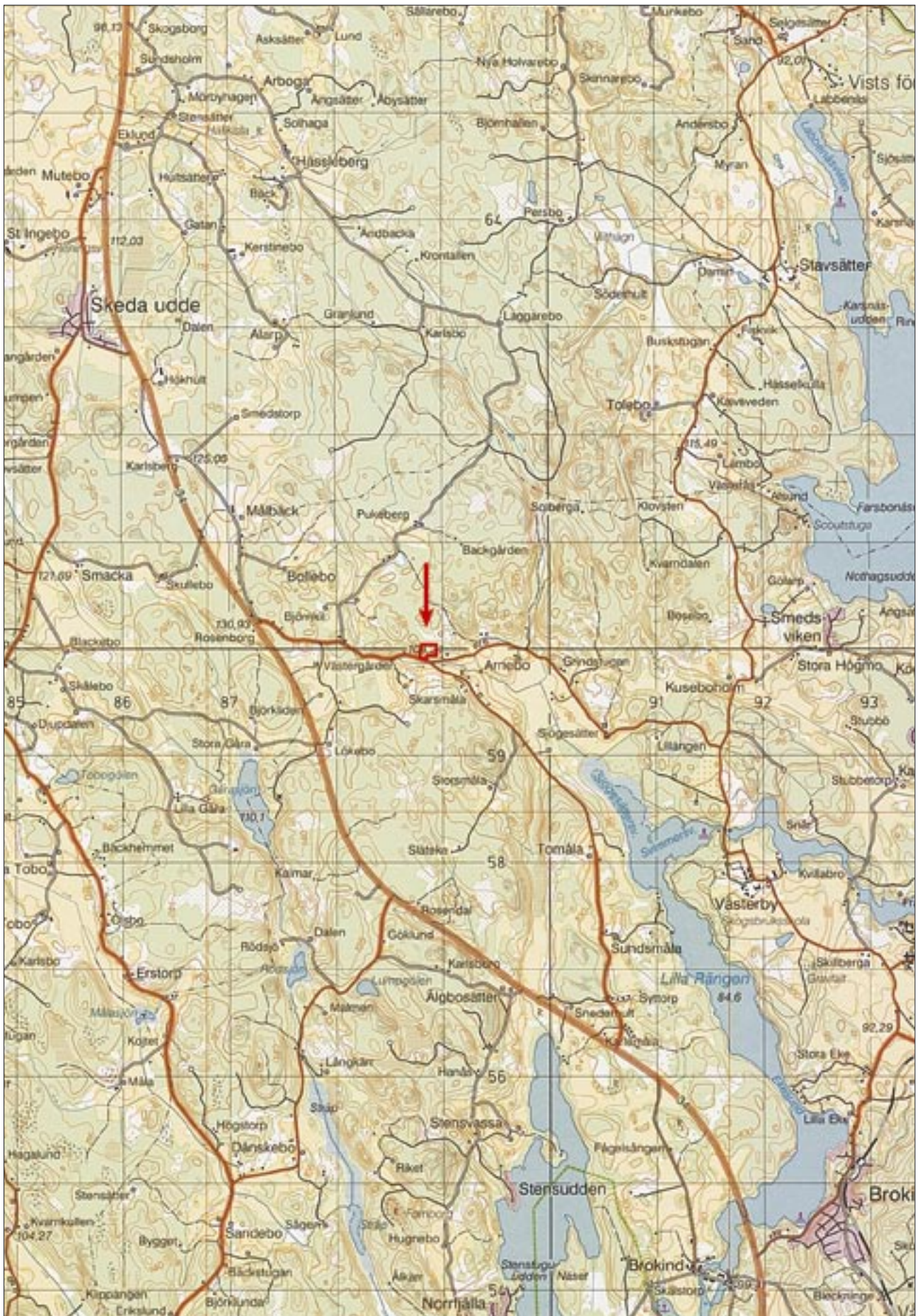
Fig 2. Utdrag ur analoga Gröna kartan med utredningsområdet markerat. Skala 1:50 000.