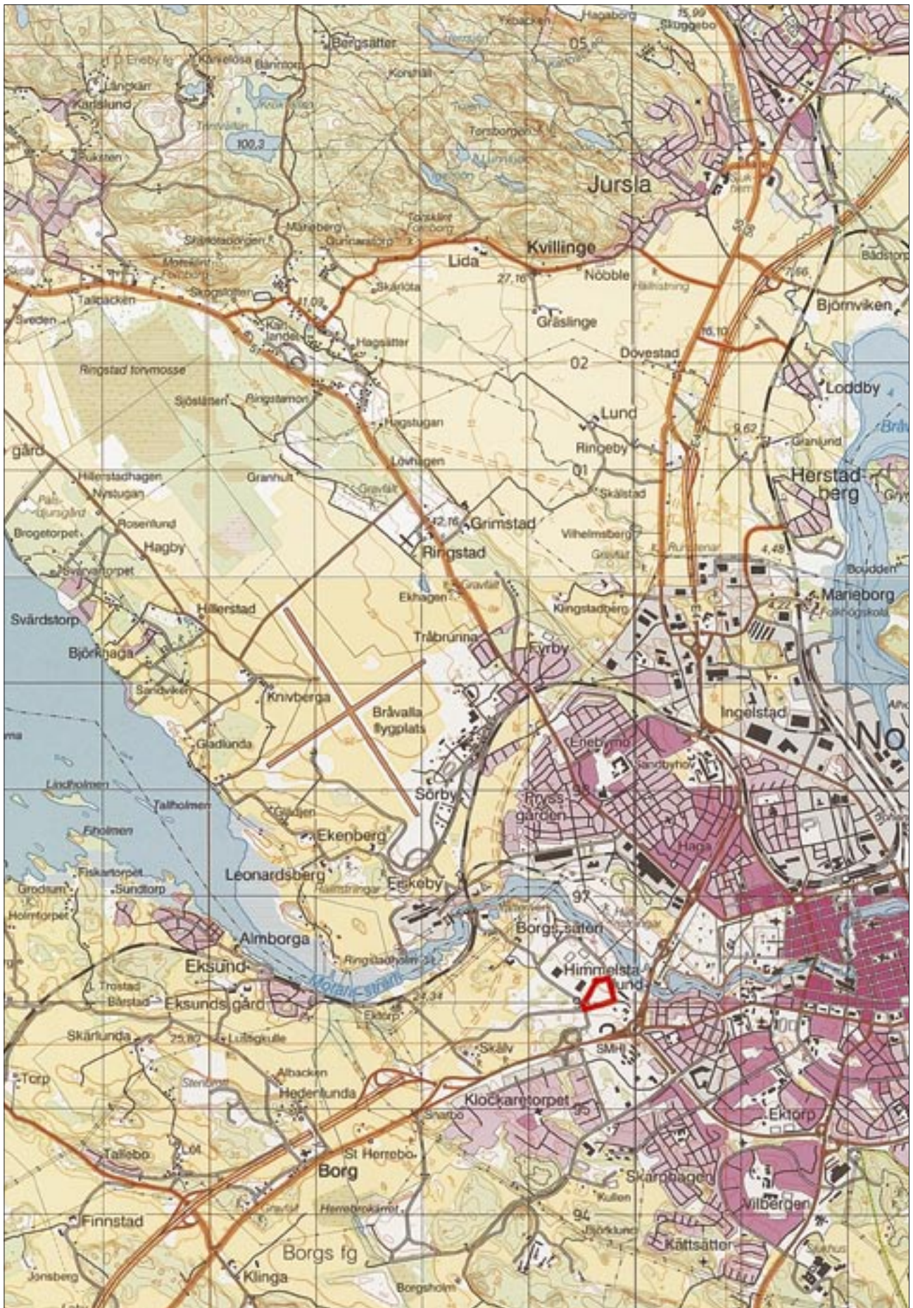
Fig 2. Utdrag ur analoga Gröna kartan med utredningsområdet markerat. Skala 1:50 000.