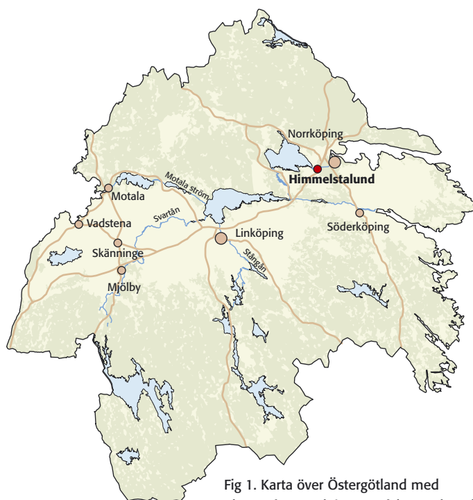
Fig 1. Karta över Östergötland med platsen för utredningsområdet markerad.