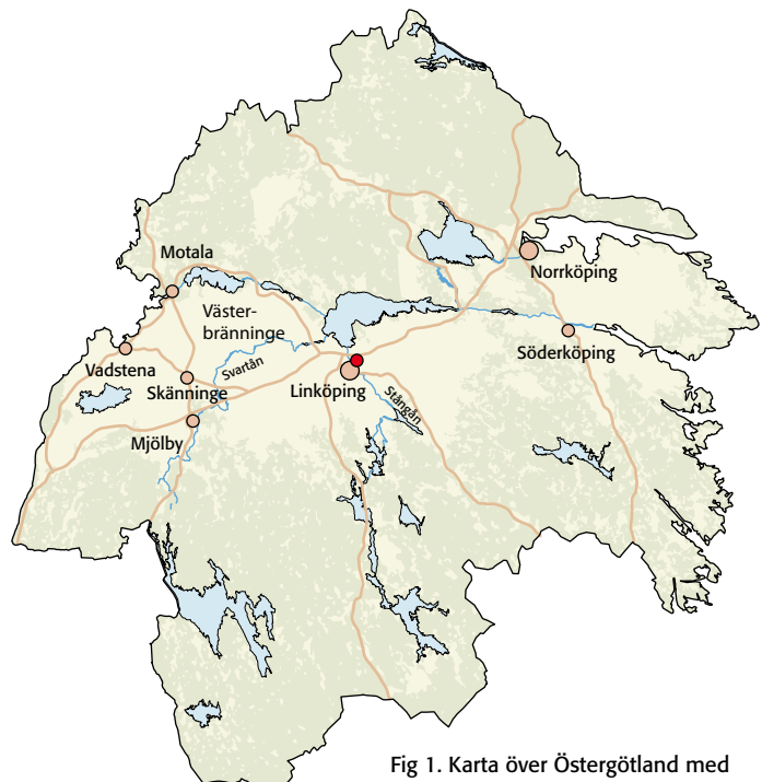
Fig 1. Karta över Östergötland med platsen för undersökningen markerad.