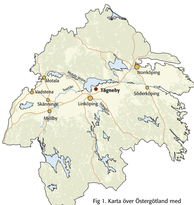
Fig 1. Karta över Östergötland med platsen för utredningsområdet markerat.