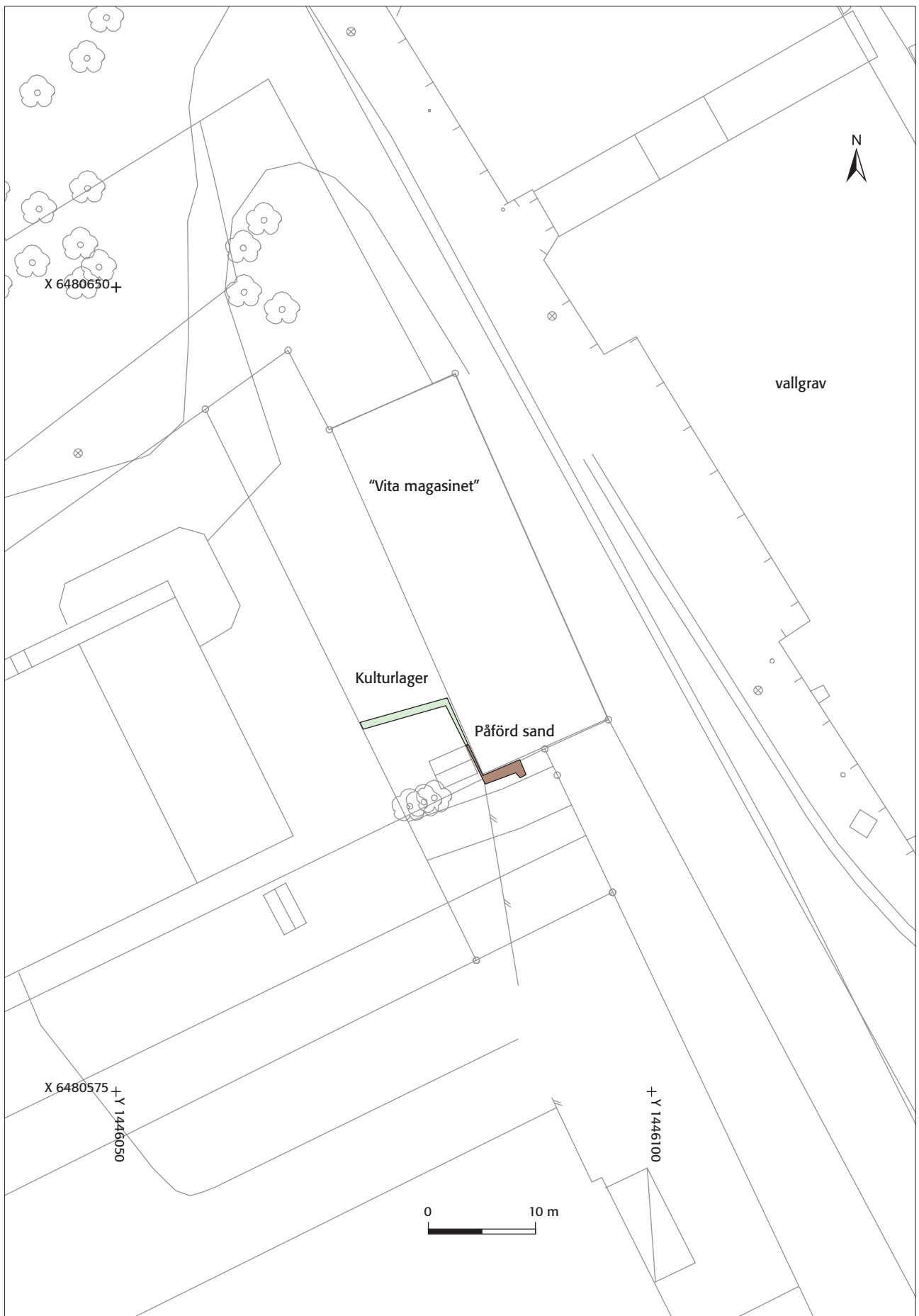
Fig 3. Schaktet grävdes sydväst och söder om "Vita magasinet", som ligger några tiotal meter väster om slottets västra vallgrav. Skala 1:500.