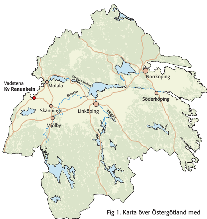
Fig 1. Karta över Östergötland med platsen för undersökningen markerad.