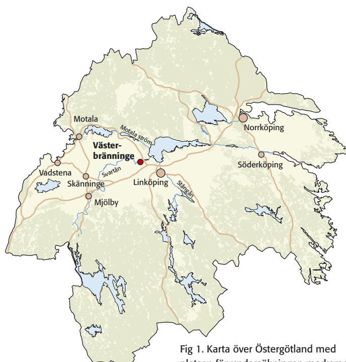
Fig 1. Karta över Östergötland med platsen för undersökningen markerad.