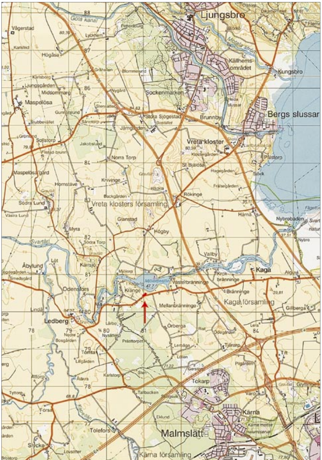
Fig 2. Utdrag ur analoga Gröna kartan med undersökningen markerad. Skala 1:50 000.