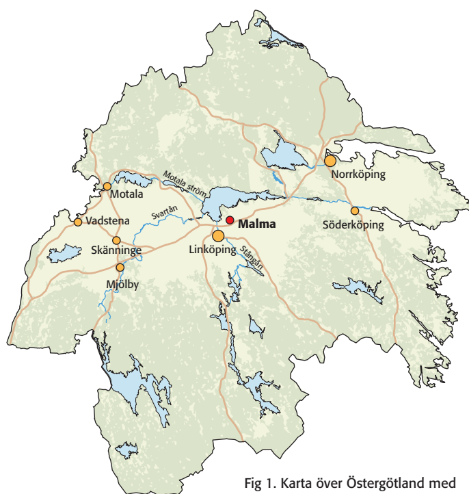
Fig 1. Karta över Östergötland med platsen för undersökningen markerad.