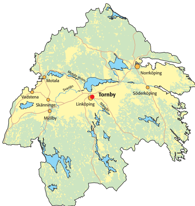
Fig 1. Karta över Östergötland med platsen för utredningsområdet markerad.