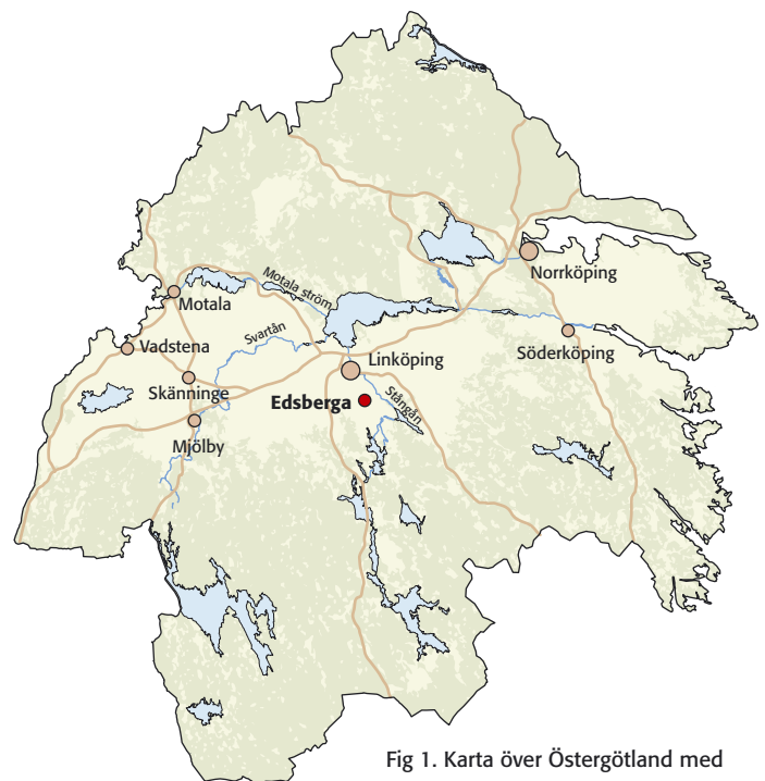
Fig 1. Karta över Östergötland med platsen för undersökningen markerad.