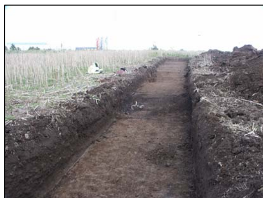
Fig 3. N delen av schakt 234 med härden/graven A235 i mitten. Observera den svaga västsluttningen. Ikanohuset kan skönjas i bakgrunden. Från V.

I nästan alla schakt som förlades i förhöjningens svaga västsluttning påträffades förhistoriska anläggningar. Anläggningarna bestod av härdar, stolphål, en grop och ett större lager som innehöll skärvsten, natursten och enstaka kvartsbitar. En av härdarna, A235, innehöll bränt ben varför det även finns misstanke om att den eller kanske alla härdar egentligen är gravar (fig 3 och 4). Brandgravar av samma karaktär med spridda brända ben är vanliga i Östergötland från äldre järnålder. Endast cirka 100 m Ö om de nu påträffade anläggningarna, under nuvarande Ikanohuset, har ett mindre gravfält undersökts på 1950-talet, RAÄ 160. Detta bestod av både stensatta gravar samt brandgravar innehållandes brända ben. Vid Biltemas nuvarande parkering, cirka 150 m SÖ om de nu påträffade anläggningarna, har ett gravfält undersökts. Detta bestod också av både stensatta gravar och brandgravar. Gravarna daterades till yngre bronsålder och äldre järnålder. Ungefär på samma avstånd från nuvarande lämningar har också boplatzlämningar påträffats, RAÄ 322 och 328.