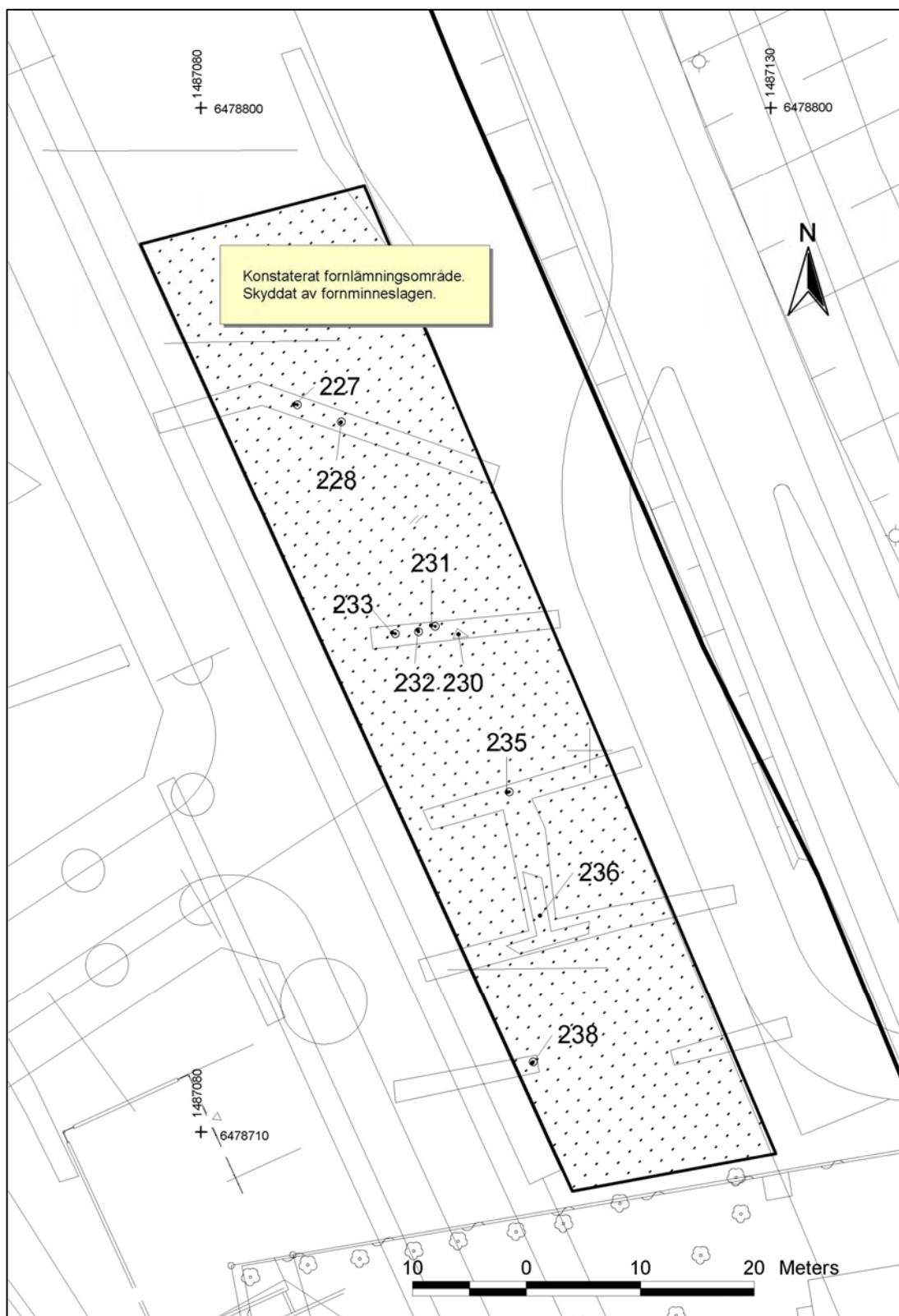
Fig 5. Utdrag ur Linköpings primärkarta med delar av den nya planerade bebyggelsen inlagd. Påträffade anläggningar är markerade samt det skrafferade området som innehåller fornlämningar och där markingrepp ej får göras.