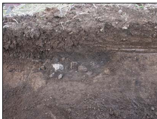
Fig 4. Härden/graven A235 i detalj. Från S.

Alla anläggningar kunde konstateras vara av förhistorisk karaktär. Flera av anläggningarna innehöll skärvsten och skörbränd sten. Inga anläggningar grävdes bort utan rensades endast