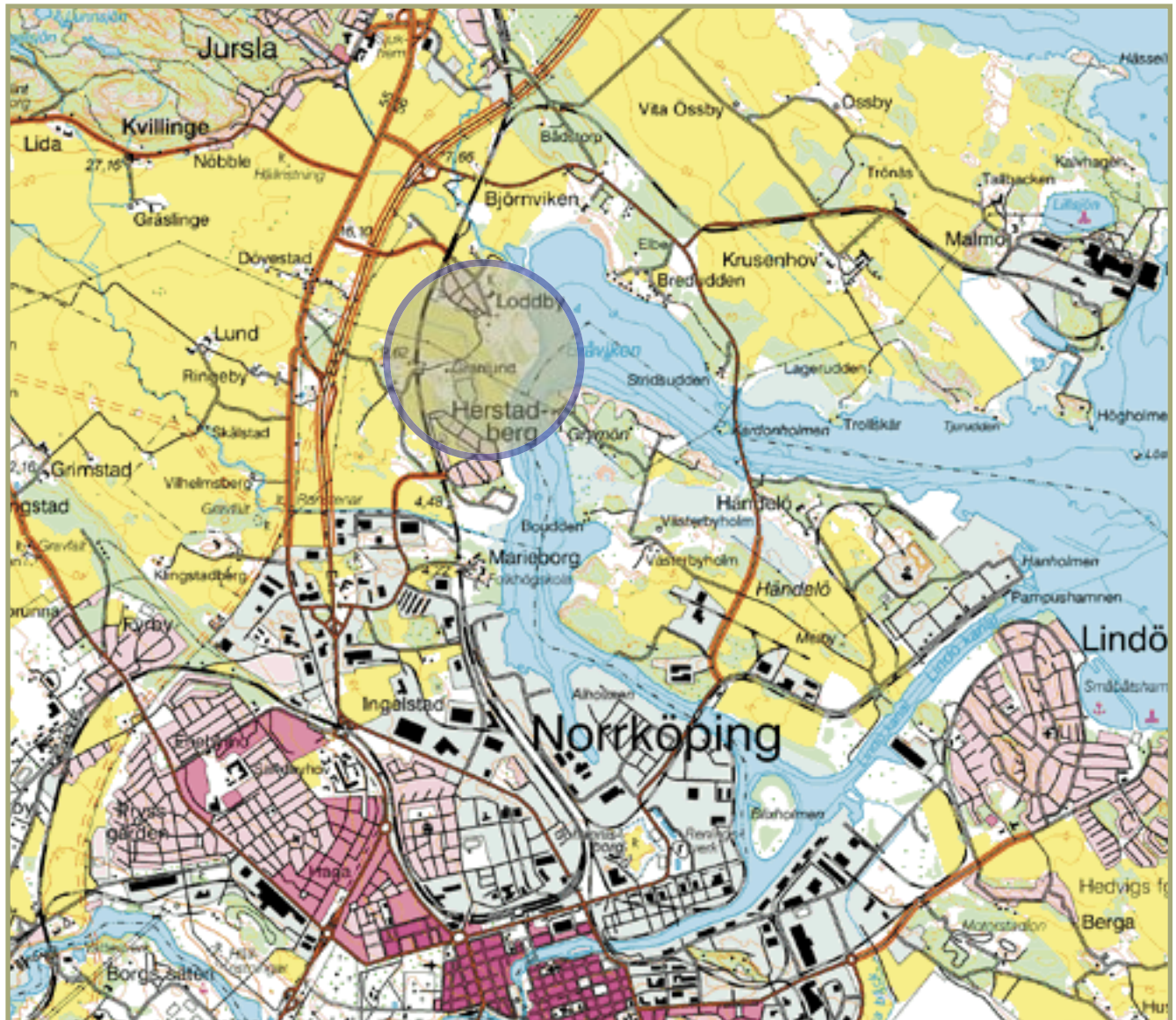
Fig 1. Utdrag ur Gröna kartan med utredningsområdet markerat. Skala 1:50 000.