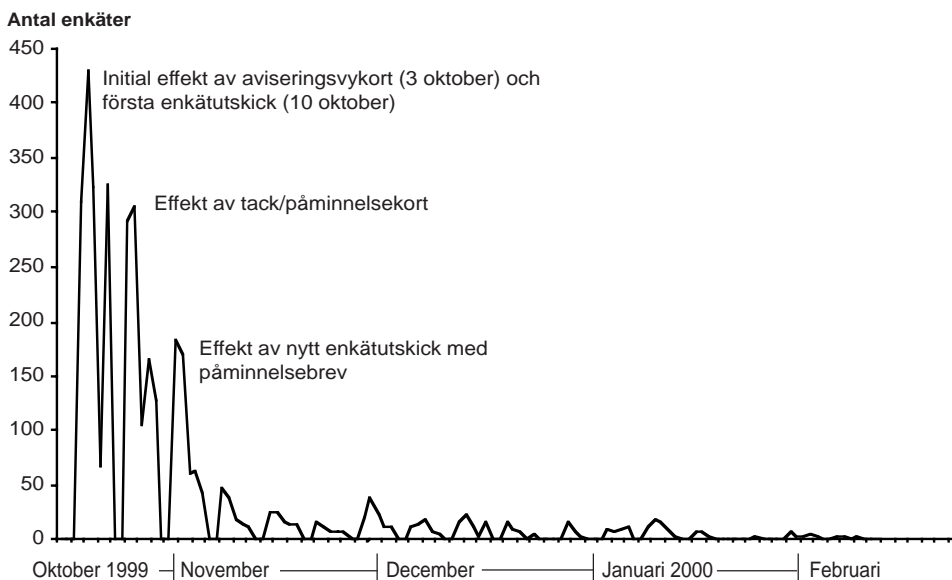
Figur 1 Inflöde av enkäter i Väst-SOM 2000 (antal)

Enkäterna började strömma in på allvar veckan efter det initiala utskicket, och tisdagen veckan därpå, den 24 oktober, hade mer än hälften av alla som skulle komma att delta i undersökningen skickat in formuläret. Tempot på inflödet var fortsatt högt under veckorna som följde. Den 31 oktober hade tre fjärdelar av alla som skulle komma att delta skickat in. En vecka in i november började enkätinflödet tunna av. I slutet av månaden – efter första telefonpåminnelsen med uppföljande brevutskick – ökade inflödet något åter. Men i huvudsak var det dagliga inflödet fortsatt lågt. Den 1 december hade 91 procent av dem som skulle komma att skicka in enkäten gjort detta. Figur 1 visar hur inflödet kommer i vågor, tydligt i fas med enkätutskick och påminnelseåtgärder. Observera dock det faktum att helgdagarna (utan postutdelning) ingår i redovisningen, något som lite bedrägligt förstärker denna vågbild i det att varje ”dalgång” därmed går ända ner till 0. Men även bortsett från de något vilseledande dalgångarna kvarstår vågbyggeffekten med all tydlighet.