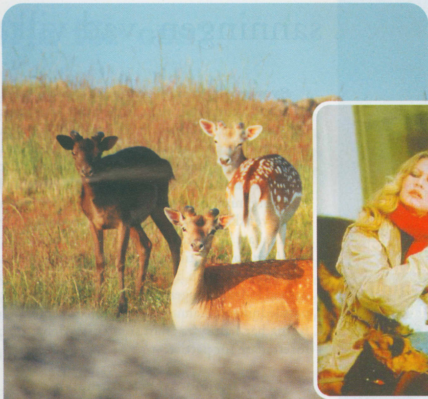
Brigitte Bardot stöder Le Pens kampanj om värdig djurhållning.