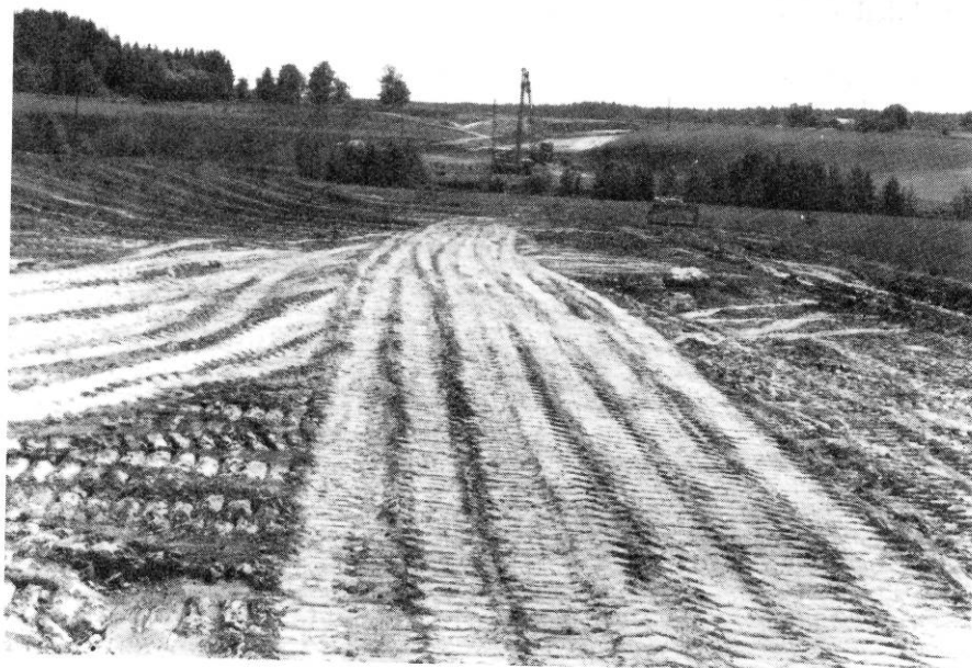
Fig 183. Väglinjen mellan Sille, i bakgrunden och Wappersta, där härdarna påträffades. I bildens mitt vid träden flyter Trosa-ån. Från N. Foto Sonja Wigren. Neg nr U401:3.

likt varit ett sammanhängande område. Vid dokumentationstillfället fanns endast rester kvar. Undersökningen genomfördes med hjälp av en grävmaskin dels på grund av tidsbrist, dels på grund av mycket dåliga väderomständigheter.