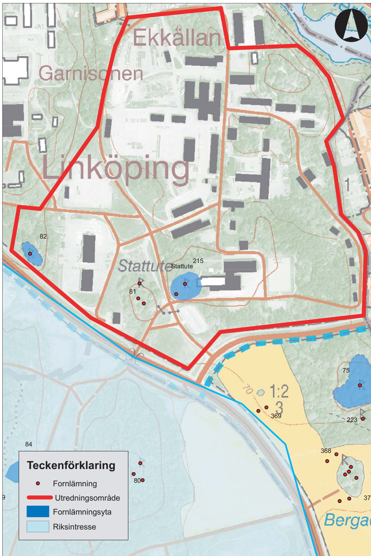
Figur 2. Utdrag ur Fastighetskartan med utredningsområdet markerat. Skala 1:5 000.