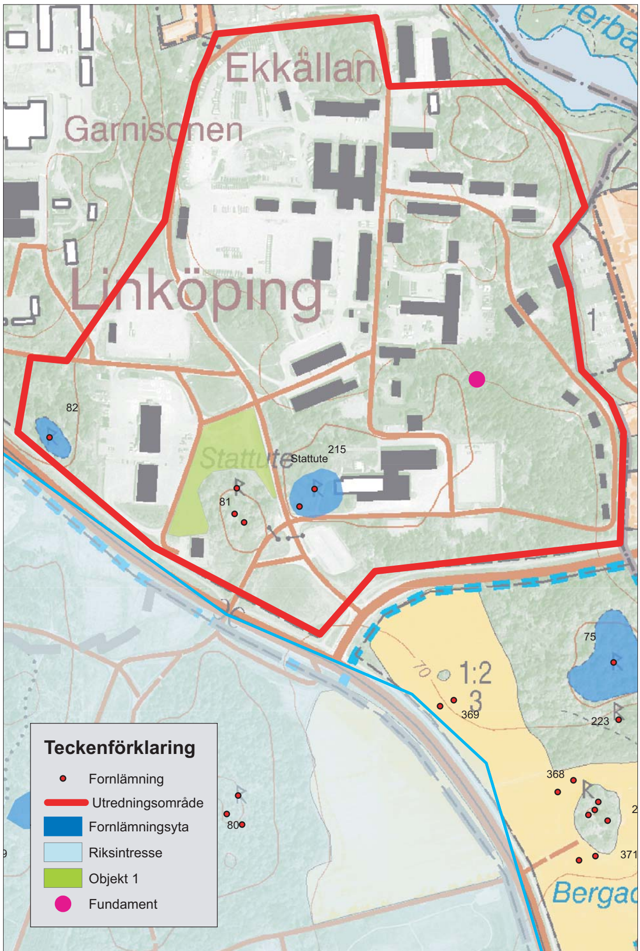
Figur 3. Utdrag ur Fastighetskartan med objektet markerat. Skala 1:5 000.