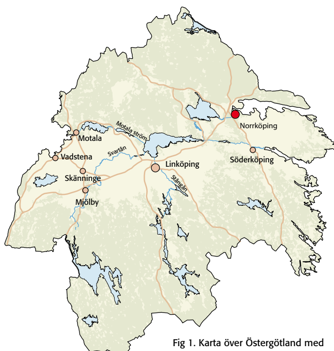
Fig 1. Karta över Östergötland med platsen för undersökningen markerad.