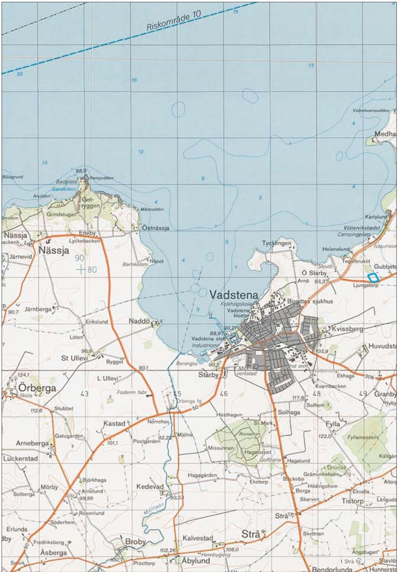
Fig 2. Topografiska kartan med utredningsområdet markerat. Skala 1:50 000.