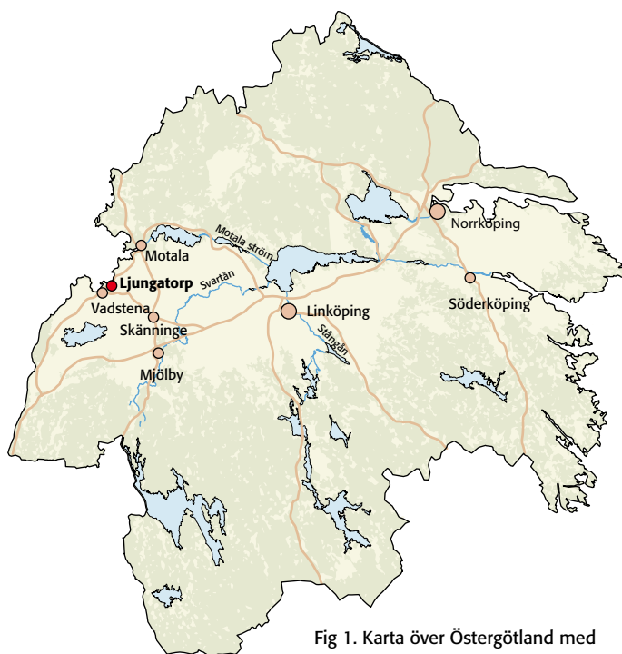
Fig 1. Karta över Östergötland med platsen för undersökningen markerad.