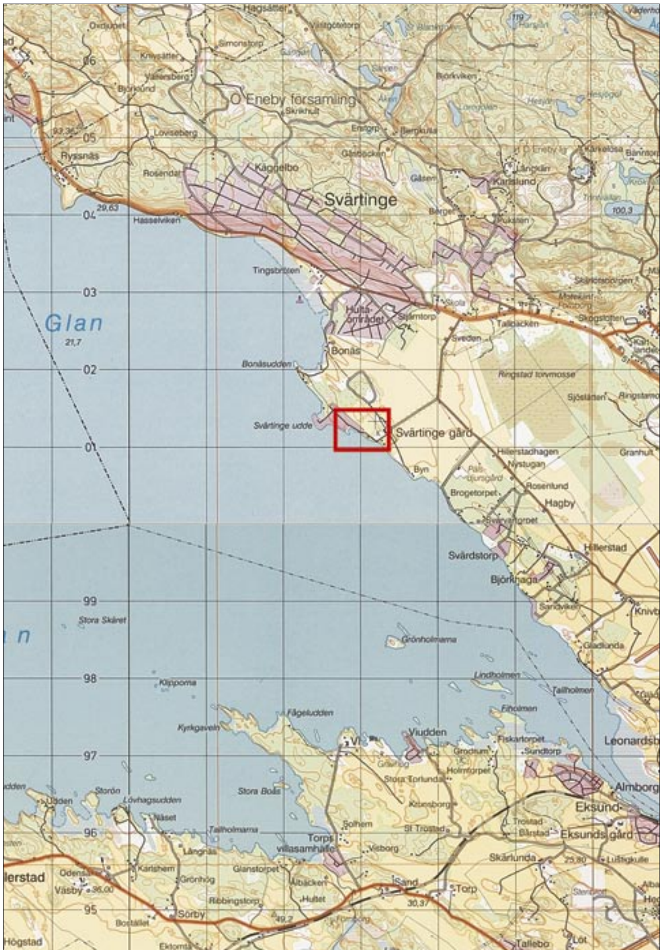
Fig 2. Utdrag ur analoga Gröna kartan (blad Katrineholm 9G SV) med undersökningsområdet markerat. Skala 1:50 000.