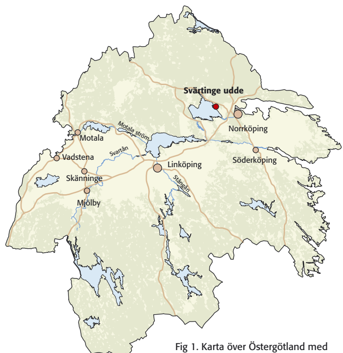
Fig 1. Karta över Östergötland med platsen för undersökningen markerad.