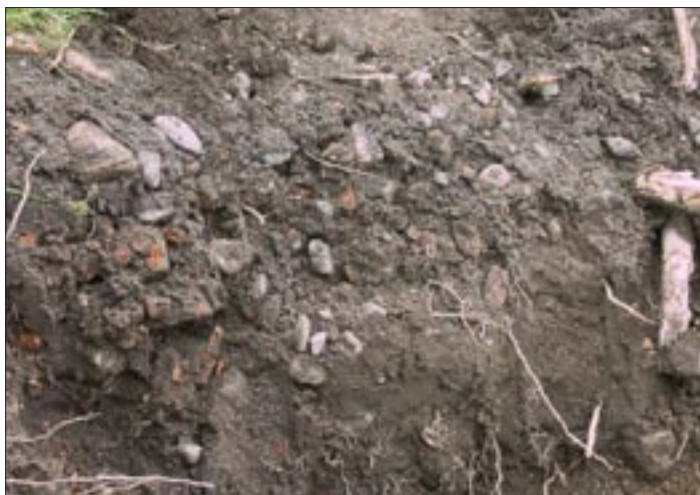
Fig 4. Under torven syntes ett lager av grovt natursingel rikligt blandat med tegelkross efter en väg som anlagts i och på ett äldre odlingslager. U4733:1