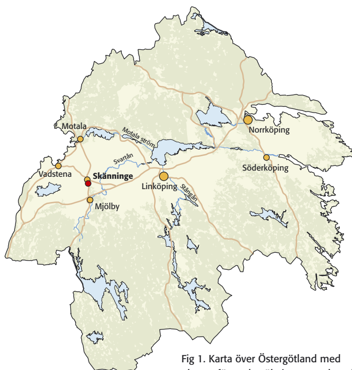
Fig 1. Karta över Östergötland med platsen för undersökningen markerad.