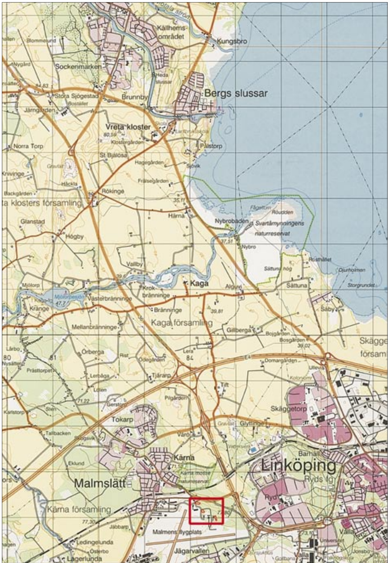
Fig 2. Topografiska kartan med utredningsområdet markerat. Skala 1:50 000.