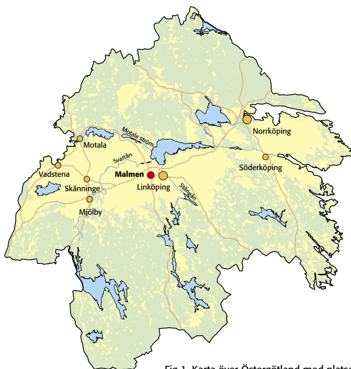
Fig 1. Karta över Östergötland med platsen för utredningsområdet markerad.