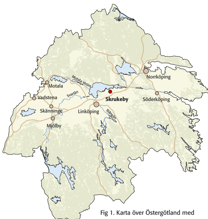
Fig 1. Karta över Östergötland med platsen för förundersökningen markerad.