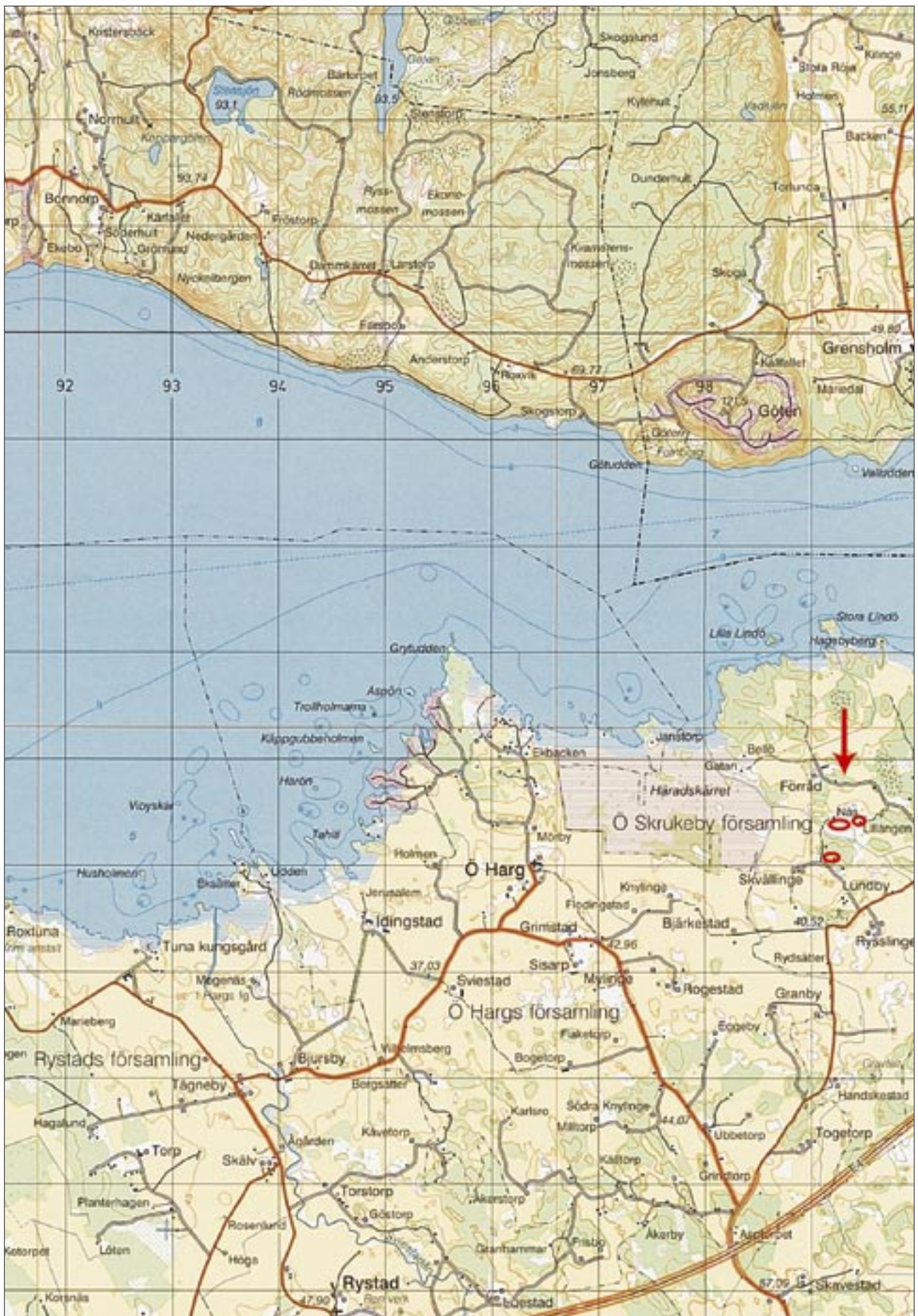
Fig 2. Utdrag ur Gröna kartan med undersökningsområdena markerade. Skala 1:50 000.