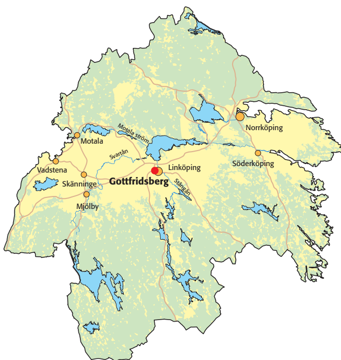
Fig 1. Karta över Östergötland med platsen för utredningsområdet markerad.