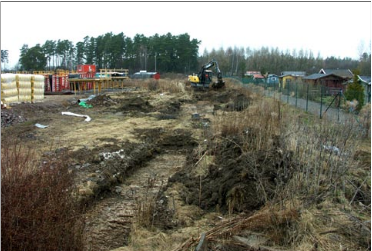
Fig 5. Grävning av sökschakt i den östra delen av undersökningsområdet.