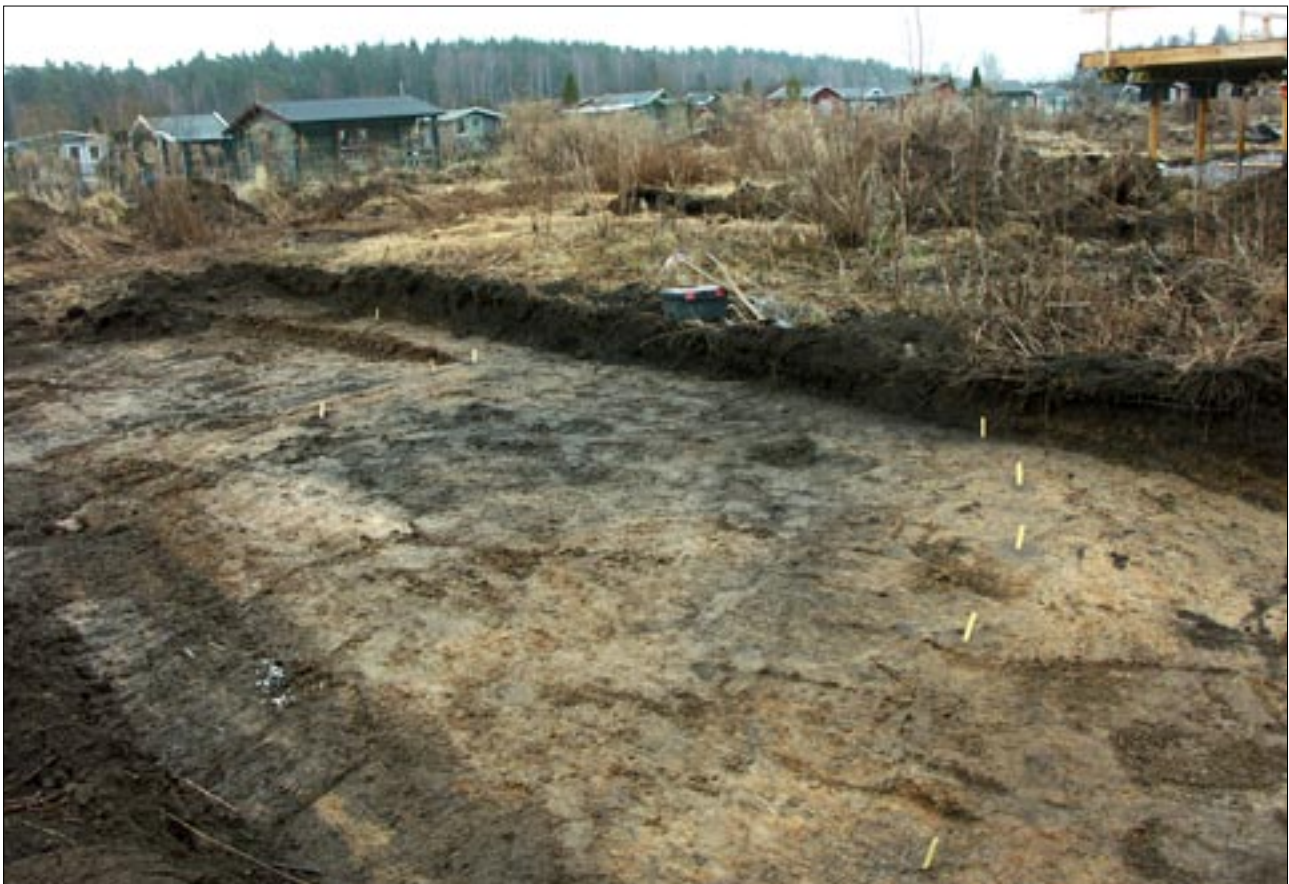
Fig 6. Huslämning i S212 i form av ett troligt golvlager vilket begränsas av stolphål i två rader.