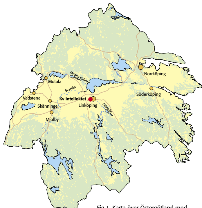
Fig 1. Karta över Östergötland med platsen för utredningsområdet markerad.

Bilaga 1. Anläggningslista, Kv Intellektet 1, Valla 1:1 12