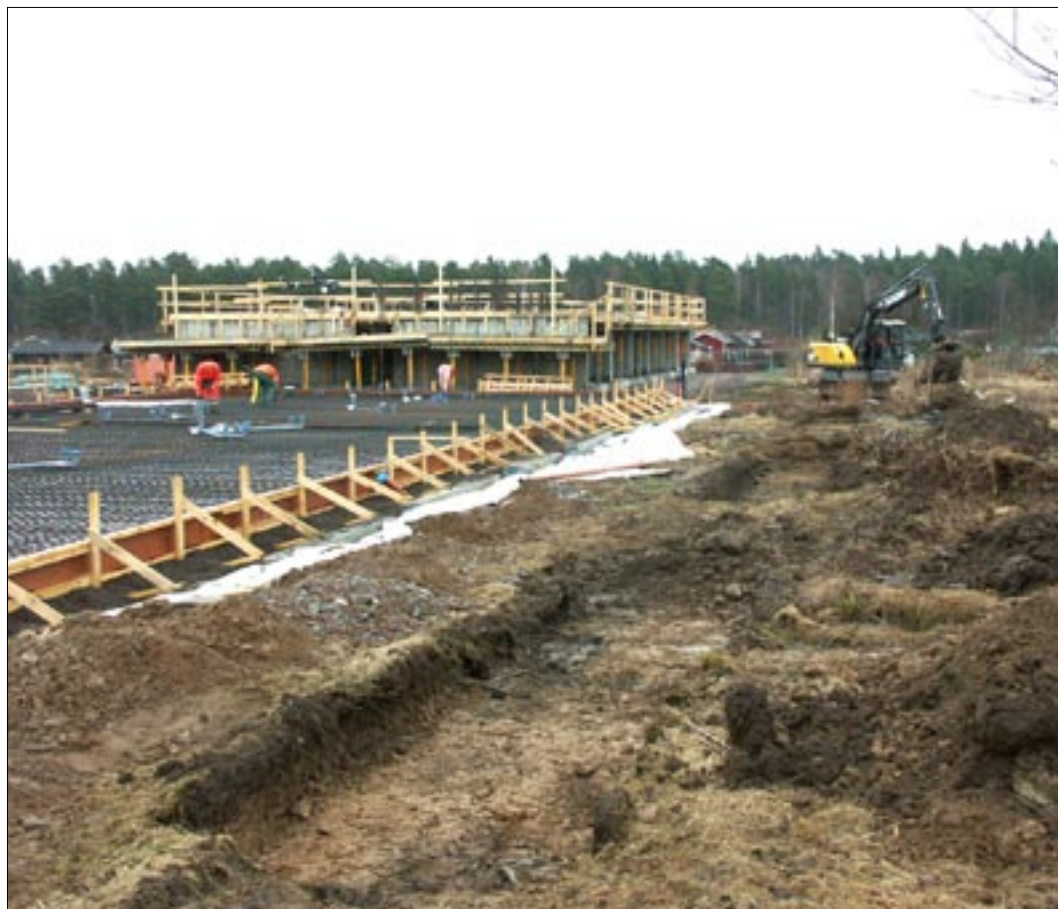
Fig 3. Grävning av sökschakt i den södra delen av undersökningsområdet. I bakgrunden syns kvarvarande delar av koloniområdet samt Vallaskogens höjdområde.

Samtliga orörda ytor uppvisade synliga spår av det tidigare koloniområdet, i form av grunder till kolonistugor, grusgångar, trädgårdsland och andra planteringar. I marken fanns även flera olika typer av ledningar nedgrävda. På så sätt var området tydligt påverkat av koloniområdets tidigare verksamhet.