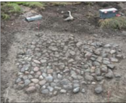
Fig 4. Stenläggning (238), sannolikt liten stensatt gårdsyta hörande till sentida ekonomibyggnader i västra delen av undersökningsområdet.