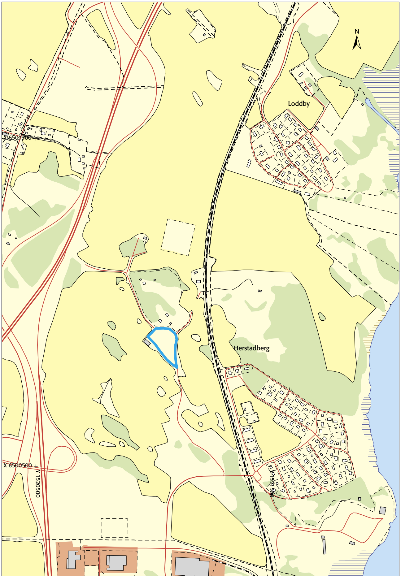
Fig 2. Fastighetskartan med undersökningsområdet markerat. Skala 1:10 000.