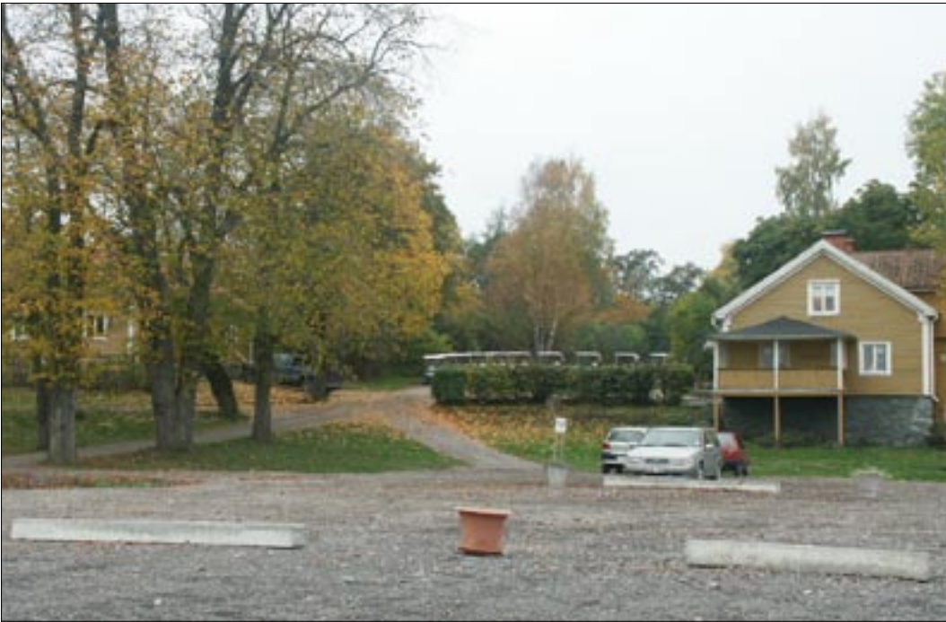
Fig 3. Flygelbyggnader som tillhört Herstadbergs säteri, norr om undersökningsområdet.