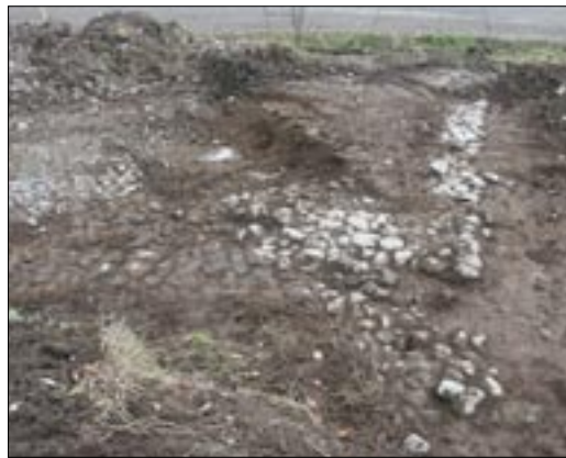
Fig 5. Stenläggningar i undersökningsområdets norra del, schakt 392, tolkade som stensatt väg från tidigmodern tid, samt sannolikt tillhörande gårdsyta.

Jean de Rogier, där det tydligt framgår att det inte fanns någon samlad bytomt, utan att denna varit uppdelad i tre olika bebyggelselägen (UV 3 a–c i utredningsrapporten). UV 3a omfattar sydslutningen av en bergshöjd, platsen för skatte- och kronogården enligt 1650 års karta. Av kartan 1676 framgår att dessa kom att slås samman till Herstadberg säteri, den nuvarande platsen för Herstadbergs gård.