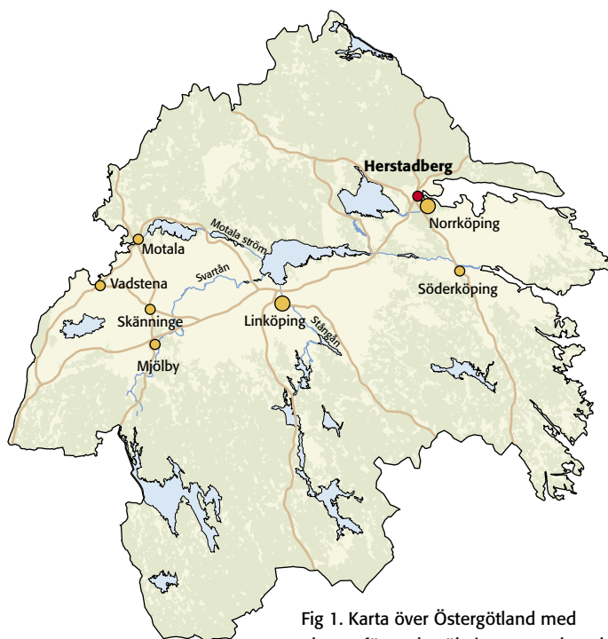
Fig 1. Karta över Östergötland med platsen för undersökningen markerad.