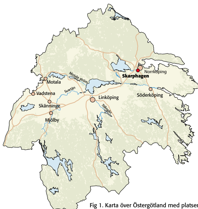
Fig 1. Karta över Östergötland med platsen för utredningsområdet markerad.