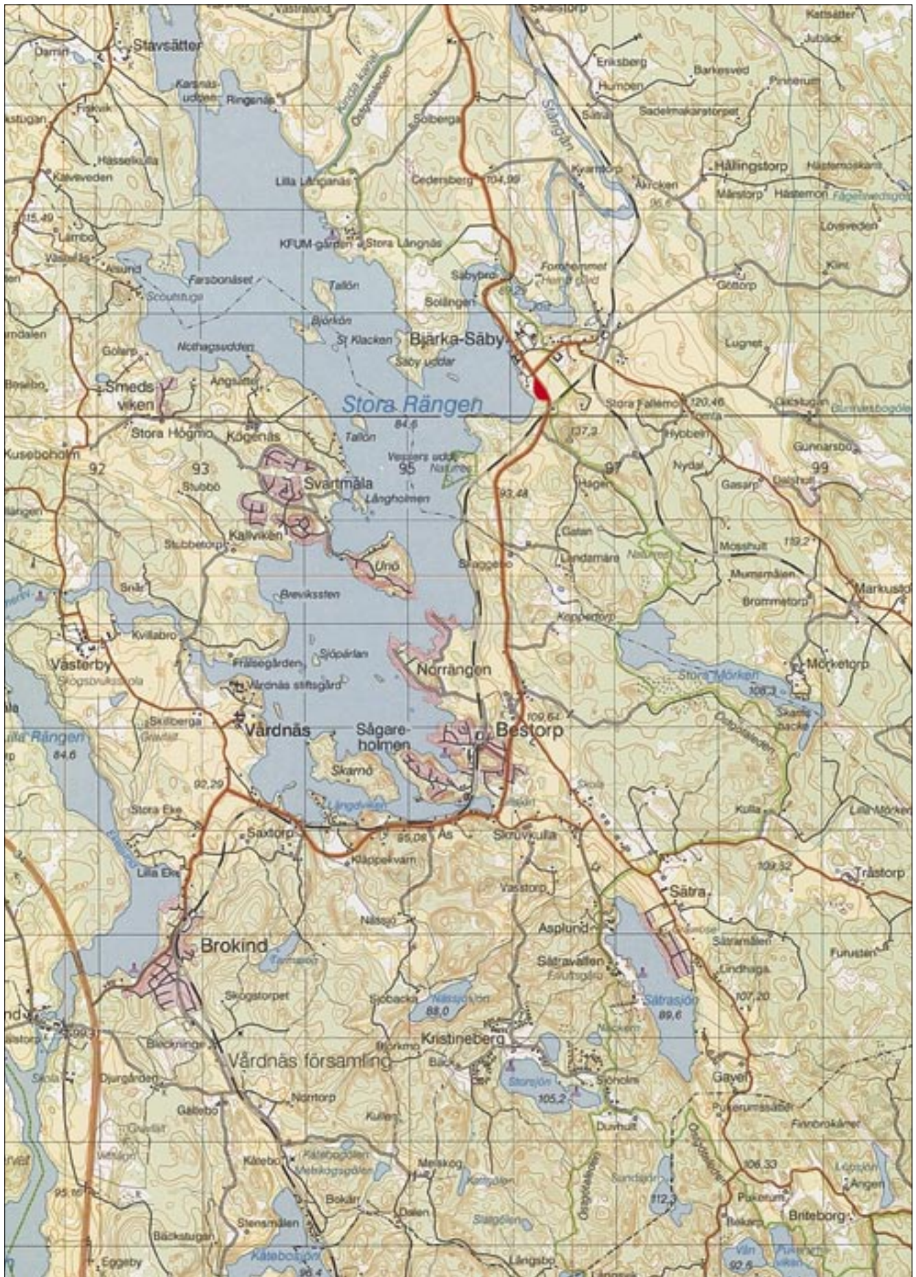
Fig 1. Utdrag ur Topografiska kartans blad Linköping 8F SO med utredningsområdet markerat. Skala 1:50 000.